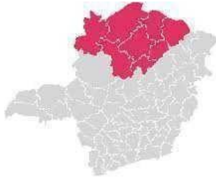
Figura 1 - Mapa de Minas Gerais com destaque para a região Norte.